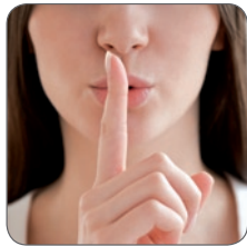
Niveau de bruit très bas

Avec la garantie Zodiac, vous bénéficiez d'une pompe à chaleur figurant parmi les plus silencieuses du marché, une donnée certifiée par le Centre de Transfert de Technologie du Mans (CTTM) selon les normes EN ISO 3741 et EN ISO 354 .