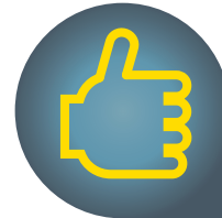
FIABLE : condenseurs en titane

Avec ses condenseurs en titane , Power First peut chauffer toutes les eaux de piscine, quels que soient l'origine et le traitement (eau de mer, traitement au chlore, au brome, ozone, produit sans chlore, électrophysique, électrochimique).