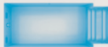
Port-Pin < config. C >