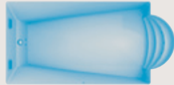
Riou < 9,00 x 4,20 x 1,20 / 1,90 m >