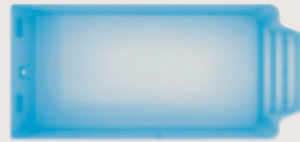
Sormiou < 7,50 x 3,50 x 1,45 m >