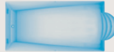
Pormiou < 10,00 x 3,90 x 1,10 / 1,90 m >