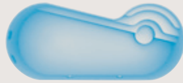
Port-Cros < 10,00 x 4,30 x 1,50 m >