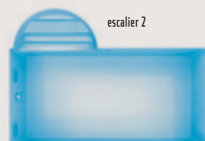
Port-Pin < config. B >