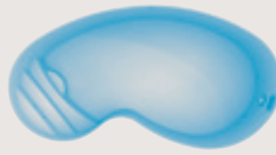
Fréjus < 8,00 x 4,00 x 1,50 m >