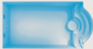
Porquerolles < 8,50 x 4,30 x 1,50 m >