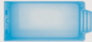
Frioul < 7,50 x 3,00 x 1,45 m >