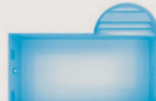
Port-Pin < config. D >