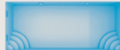
Cassis < 10,30 x 4,30 x 1,60 m >