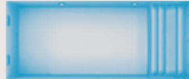
Bendor < 10,30 x 4,30 x 1,60 m >