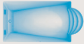
Bandol < 7,50 x 3,85 x 1,10 / 1,75 m >