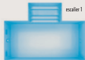
Port-Pin < config. A >