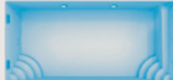
Planier < 9,00 x 4,30 x 1,60 m >