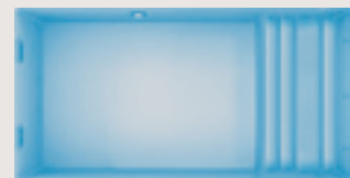
Sugiton < 8,50 x 4,30 x 1,55 m >