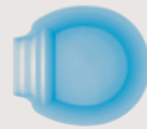
Piana < 5,00 x 4,30 x 1,30 m >